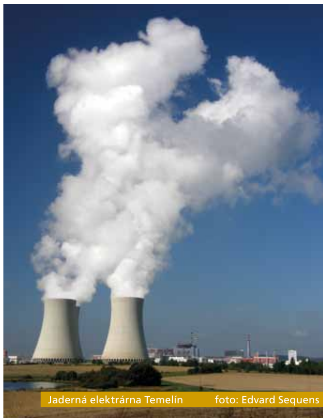
Jaderná elektrárna Temelín

Oteplování podnebí ohrožuje provoz jaderných elektráren – omezuje dostupnost vody na jejich chlazení. A například v horkém létě roku 2018 musela