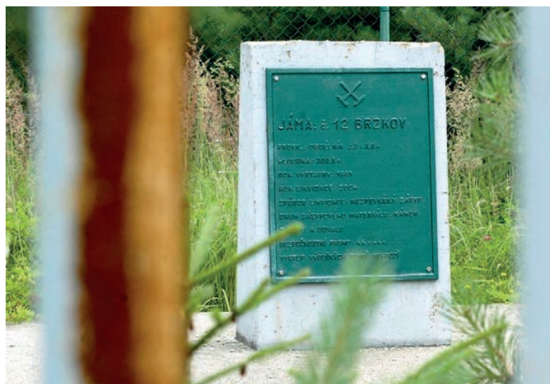
300 metrů hluboká těžební jáma u Brzkova by mohla být znovu otevřena