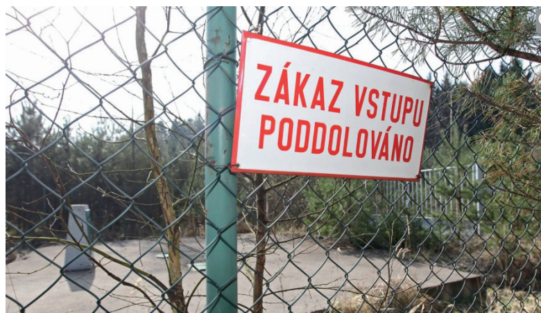
Důl v Brzkově byl vyhlouben na konci osmdesátých let minulého století. Uskutečnili se zde průzkumné práce, při nichž bylo vytěženo asi 65 tun uranové rudy.