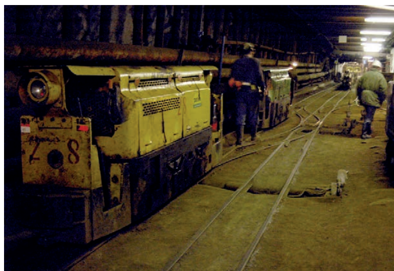
Po ukončení těžby v uranovém dole Rožná chce státní podnik Diamo otevřít těžební ložisko uranu u Brzkova na Jihlavsku