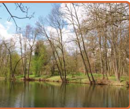
Prostřední rybník v zámeckém parku v Budišově.