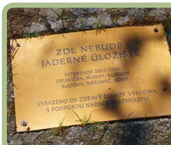
Pamětní deska z 2004 proti úložišti poblíž Budišova

vydávají, jsou keramické přívěšky v podobě čtyřlístku. Vytvořily je děti z rudíkovské školy. Ať tedy nejen jim přinesou štěstí! Simona Bernátová, Zdravý domov Vysočina