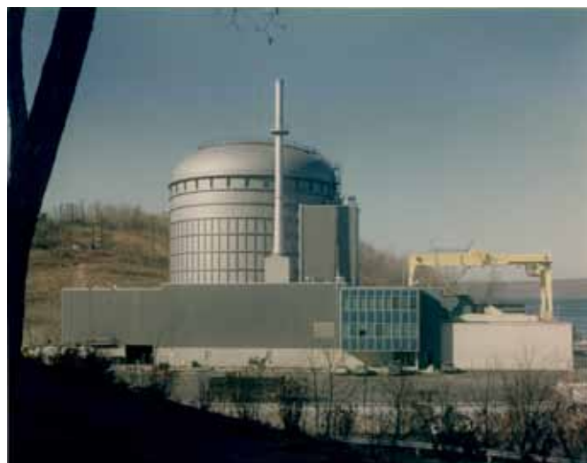
Atomová elektrárna Peach Bottom 1

Ale zpráva národních akademiků varuje, že vyhořelé palivo, které se hromadí v amerických jaderných elektrárnách, je také náchylné k tomuto scénáři. Po odstranění vyhořelého paliva z jaderného reaktoru dochází k rozpadu radioaktivních štěpných produktů, při kterém se uvolňuje teplo. Všechny jaderné elektrárny skladují palivo ve svém areálu na dně hlubokých bazénů nejméně po dobu čtyř let, během nichž se palivo pomalu ochlazuje. Komise pro jadernou regulaci (NRC) odhaduje, že rozsáhlý požár v bazénu s vyhořelým palivem v jaderné elektrárně Peach Bottom v Pensylvánii by vysídlil odhadem 3,46 milio-