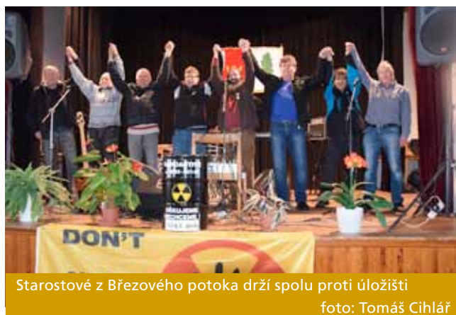
Starostové z Březového potoka drží spolu proti úložišti

Můžeme za touto snahou předpokládat výhodné ekonomické zájmy při budoucí stavbě, byznys a tlak skupin provádějící průzkum lokalit i zisky z obchodu s jaderným odpadem z jiných zemí, které úložiště budovat nebudou. Proto zřejmě nemají představitelé státu zájem na novém zákonu, který by vedl k posílení práv obcí. Patrně proto „jdou na ruku“ SÚRAO příslušná ministerstva, poslanci, senátoři a situace pro starosty a zastupitelstva v Pačejově tak bude v budoucnu velmi těžká. Všechny legislativní trumfy dnes bohužel drží v rukou stát a dává to svým postojem obcím náležitě znát. Lidé v Pačejově zavázali své