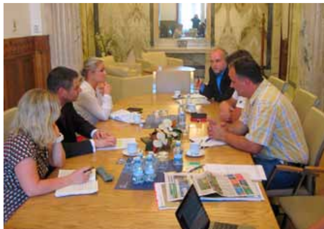
Zástupci Platformy se sešli s ministrem průmyslu a obchodu Havlíčkem