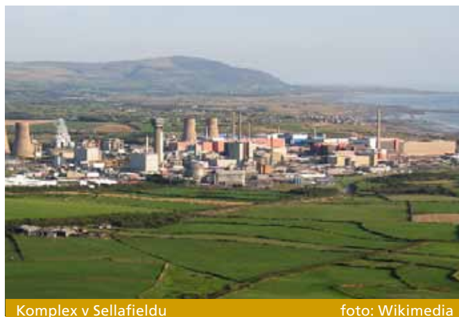
Komplex v Sellafieldu

Kontaminace byla podle výzkumného týmu způsobena výpustmi kapalného radioaktivního odpadu ze závodu na přepracování vyhořelého jaderného paliva