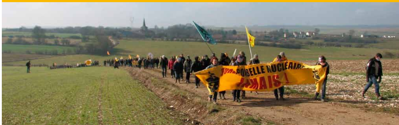
Protesty proti úložišti ve Francii nabývají na síle